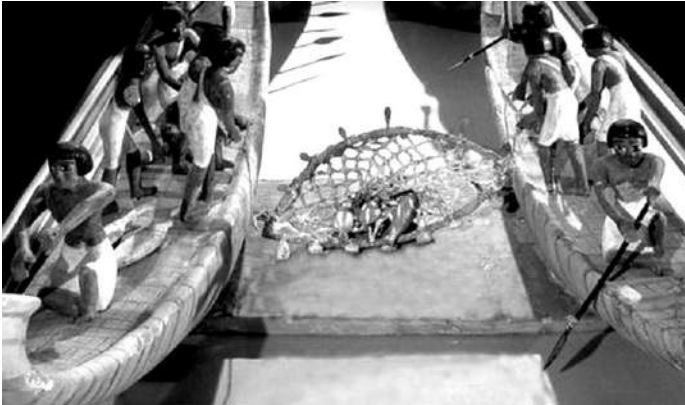
Embarcations de pêcheurs, Moyen Empire, XIe dynastie, Vers - 2 000, bois peint, Le Caire, Musée égyptien.

Après avoir étudié l'histoire de l'art égyptien de l'Ancien Empire et de la Première Période Intermédiaire, nous passons au Moyen Empire qui couvre les XIe, XIIe et XIIIe dynasties (- 2 033 à - 1 710). Les souverains de la XIe dynastie rétablissent l'unité. Les transformations sensibles dans le domaine artistique apparaissent sous le règne de Nebhepetrê Montouhotep, qui unifie l'Égypte et renoue avec la grande architecture de pierre. Gouvernant la Haute et la Basse-Égypte, le pharaon aurait disposé de moyens accrus permettant le passage à des proportions grandioses. Les tombeaux des premiers rois du Moyen Empire ont été retrouvés sur la rive gauche de Thèbes, la nouvelle capitale. La région de Thèbes-ouest a livré de très beaux exemplaires de sarcophages en pierre finement sculptée. Cette période a également connu la mode des figurines de serviteurs, formant des groupes très élaborés, reproduisant des pelotons d'archers ou de lanciers, des ateliers d'artisans, des barques de pêche et leur équipage.